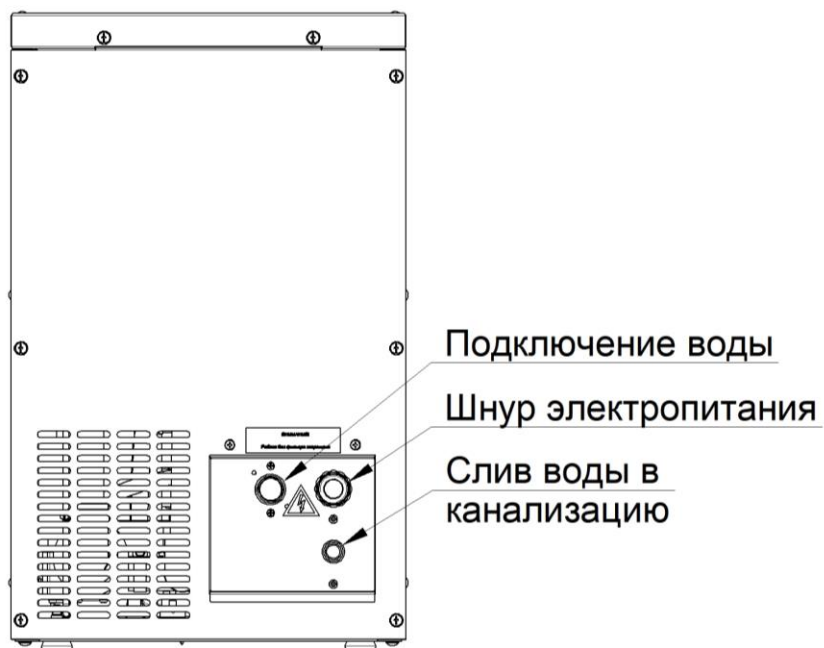
Рис. 2. Схема подключения льдогенератора